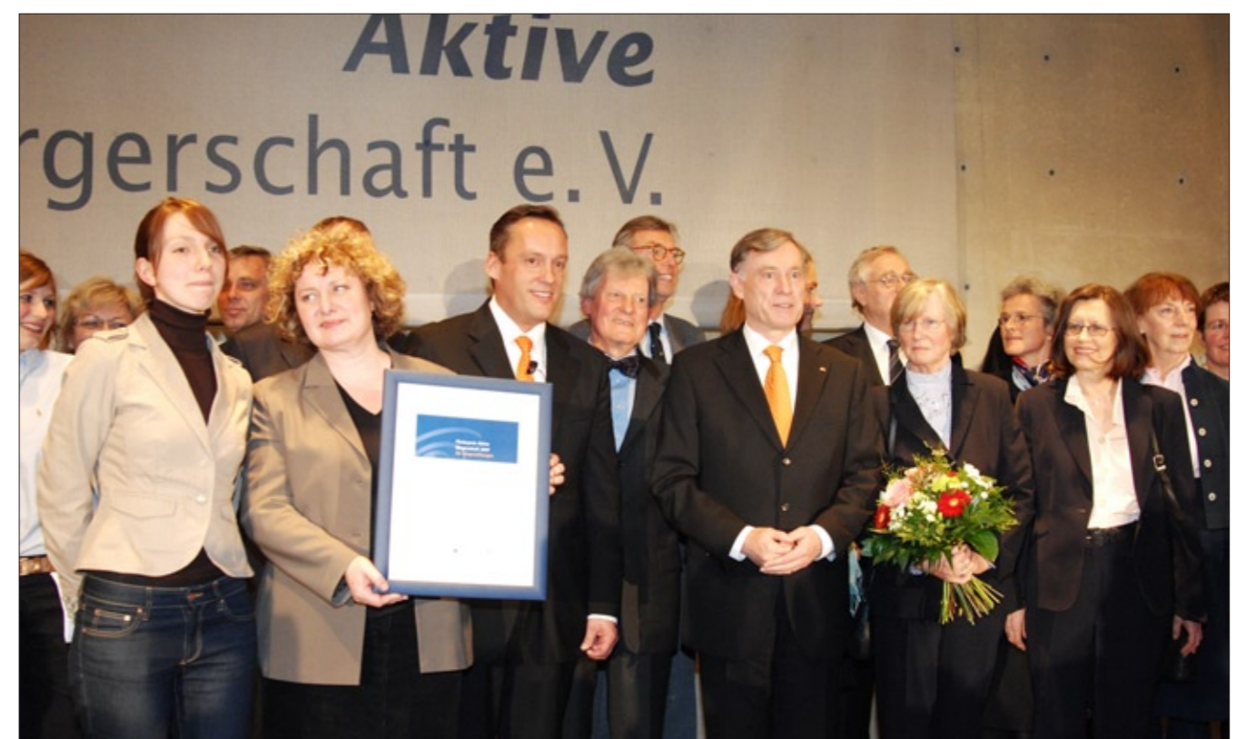
Preisträger des Förderpreises Aktive Bürgerschaft